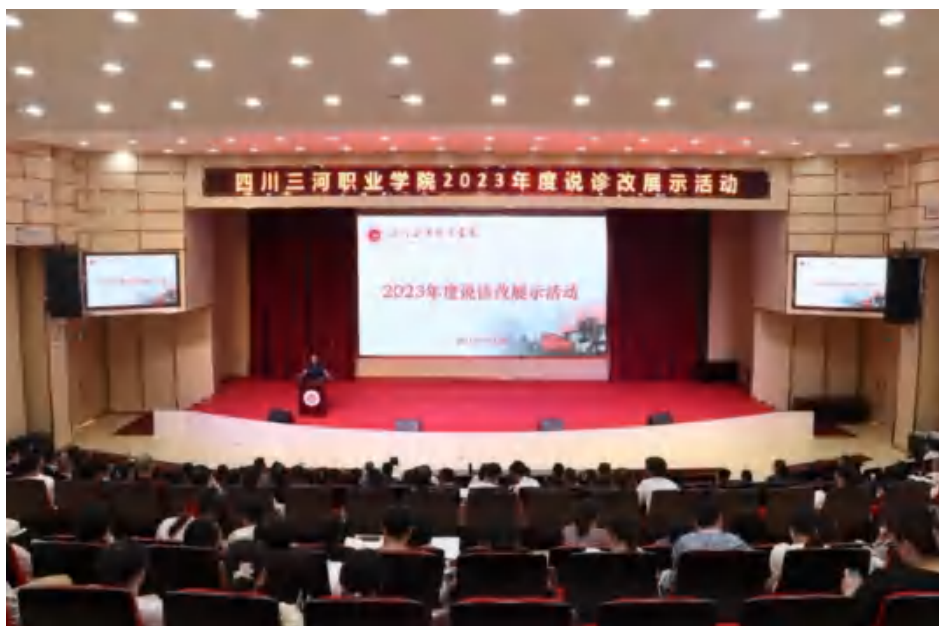
图5 学校持续深入开展诊改，常态化举办年度说诊改比赛