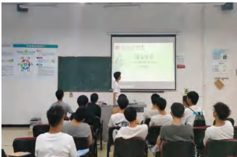
图9 学生开展心理健康教育主题班会