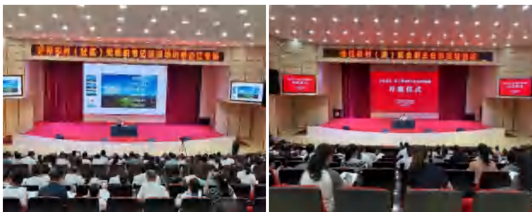
图 24 学校开展村社干部培训

学校受合江县组织部委托,于2023年4月至7月期间,先后开展5期村社干部培训。来自27个村社党组织书记、副书记、村委主任、监委主任、村文书等632人参加了培训。