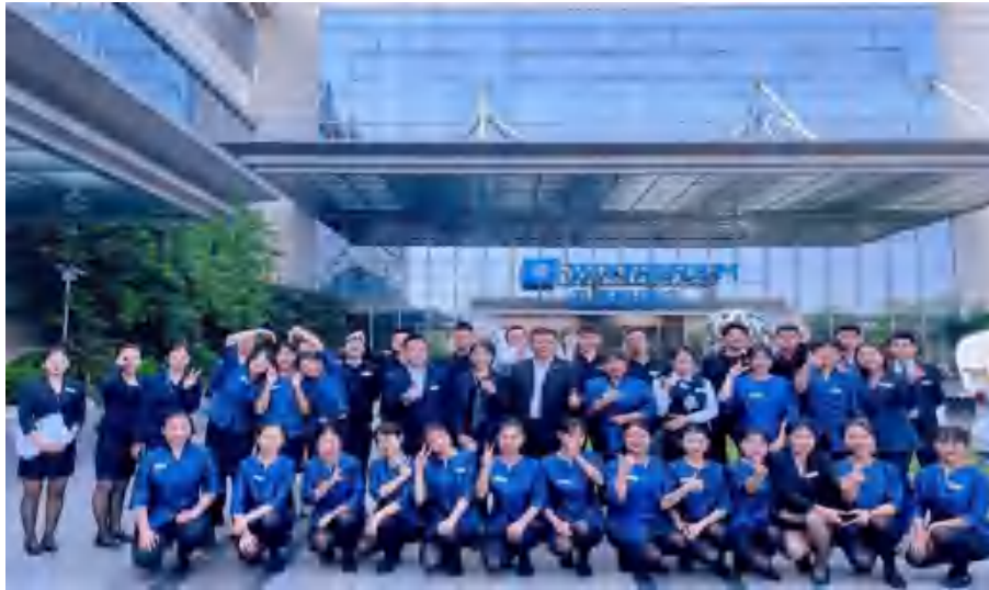
图 19 经济管理学院与合作企业开展课程“订单式”培养

——学校现代农业技术学院先后与泸州三益生态农业发展有限公司、泸州欣旺动物医院有限公司、四川省茶业集团股份有限公司、合江县现代农业园区服务中心等企事业单位开展合作，成功创建了泸州市合江县现代农业园区乡村振兴高技能人才培育基地、四川省第五批粮食安全宣传教育基地。2023 年邀请企业高级畜牧兽医师、高级农艺师到校开展 6 场专题讲座，共同培育县级高素质农民 270 人，组织学生参与真龙柚授粉、彩色马铃薯种植、蘑菇种植等农业生产实践 1080 人次。