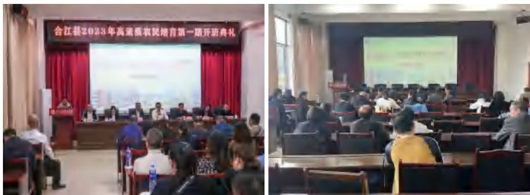
图 28 学校开展高素质农民培育