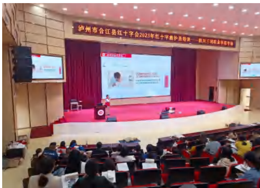
图 10 校红十字会开展学习活动

达镇等地举行了 6 次捐赠活动，合计衣物 600 余箱，折合人民币 50 余万元。