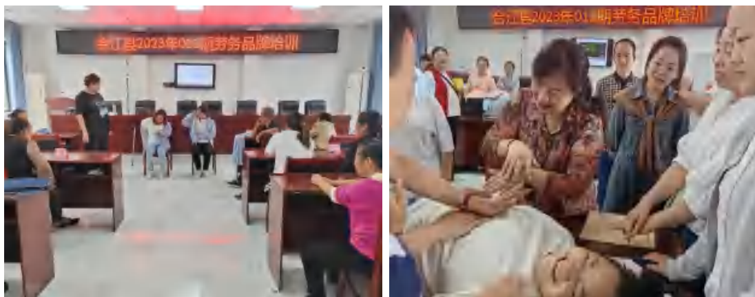
图 23 学校开展劳务品牌培训

学校受合江县人社局委托,于2023年9月至11月期间,先后开展了四期劳务品牌培训,培训专业老年护理135名,全部学员参加专项能力考核鉴定并获得专项职业能力证书。