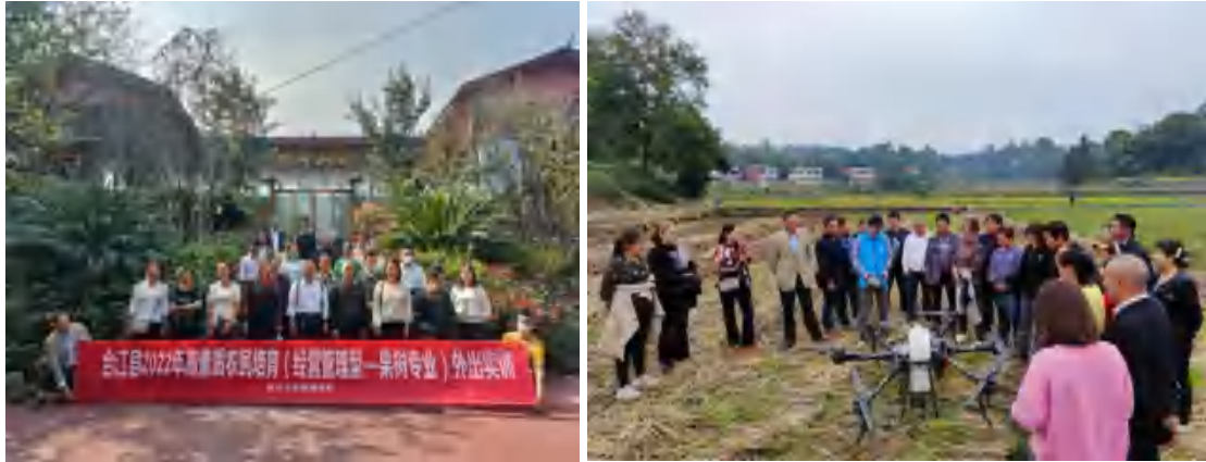
图 29 高素质农民知识、技能更新培训