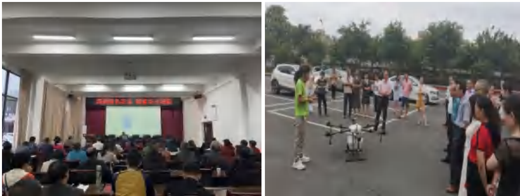
图 27 学校开展基层农技人员培训

学校受江阳区农业局委托，于 2022 年 10 月 17 日至 26 日期间，先后开展了 2 期基层农技推广人员培训，来自江阳区农业农村局和基层乡镇农技服务中心的 78 名学员参加了培训。