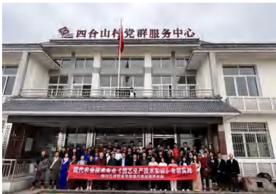
图 20 现代农业技术学院与合作单位开展学生专项技能实践

——学校工程技术学院工程技术学院持续与旭硕科技（重庆）有限公司依托现代学徒制试点项目，探索电子信息工程专业“任务⇌中心⇌工岗”现代学徒制人才培养模式。专业围绕工岗任务构建“一主线、三能融合”的课程体系，协同搭建校企互补的实践中心，校企双方共同制定人培方案、岗位考核标准、共同实施教学，三阶段工学交替的岗位实践形成特色。2023年，21级、22级电信专业现代学徒制分别召开了阶段性实习总结会。与深圳市嘉立创科技发展有限公司联合开展《电子电路制图》课程改革实践，为电信专业60人PCB项目设计提供了支持。依托泸州市智能机电控制工程技术研究中心、泸州市李凌林铣工技能大师工作室、四川省高技能人才培训基地等平台条件，开展泸州市社区矫正人员培训31人，完成中级工培训323人，高级工培训358人。