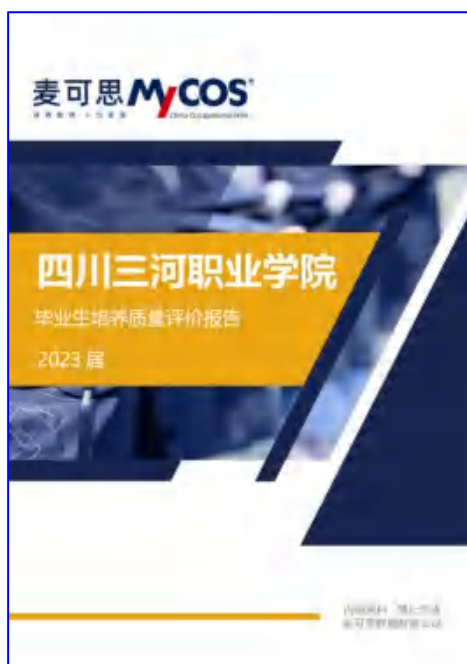
图 15 麦可思公司出具学校 2023 年毕业生就业质量年度报告

占比 87.6%。根据麦可思《四川三河职业学院 2023 年毕业生 就业质量年度报告》显示：（1）2023 届毕业生就业相关度 为 68%，平均月收入为 3892 元，薪资或职位有提升的占比 43%，就业于中国 500 强企业的占比 14%，就业满意度为 82%， 对就业服务工作的满意度为 93%；（2）2023 届毕业生西部 就业占比 89.5%、成渝地区双城经济区就业占比 68.6%、省 内就业占比 75.7%（其中泸州 24.4%、成都 20.9%），主要就 业行业包括医疗和社会护理服务业（33.6%）、教育业（8.9%）、 建筑业（7.8%），学校的区域贡献度高；（3）此外，2023 届毕业生升学率为 15.35%，创业率为 5.8%。