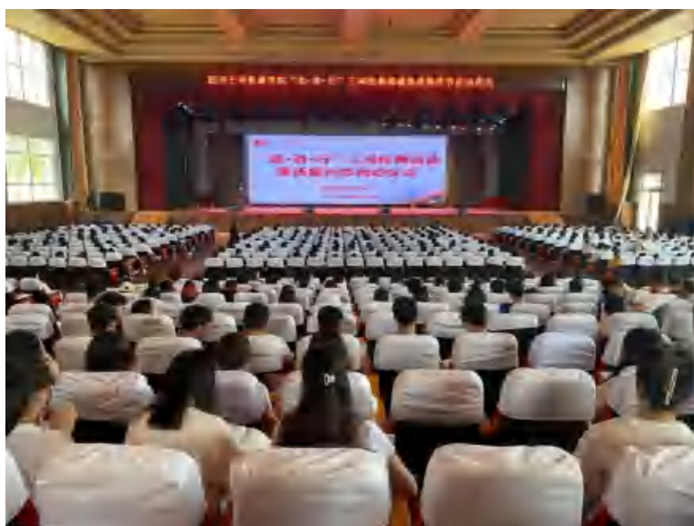
图 11 “读·讲·行”三河经典阅读素质提升节启动仪式