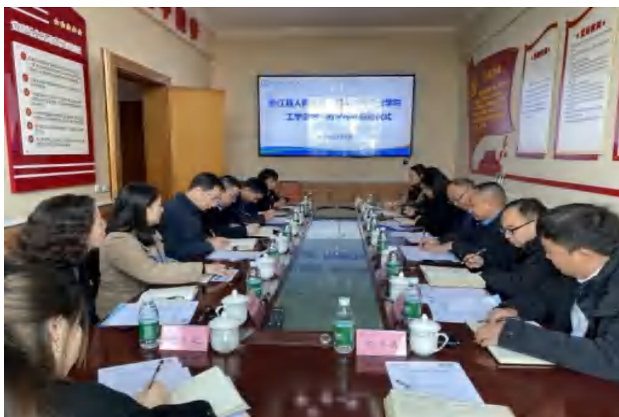
图 18 卫生健康学院与合作医院开展“工学交替”共同培养学生

——学校卫生健康学院先后与合江县人民医院、合江县中医医院、泸县人民医院共建四川三河职业学院非直管附属医院和双师型教师培训基地。2023 年，医院接收教师挂职锻炼 8 人，接收学生临床实习 2248 人次；学校培训医院员工 92 人次，聘请医院校外兼职教师 30 余人；与合江县人民医院举行“工学交替”教学模式，每两周为单位按班级滚动派出学生入医院见习。