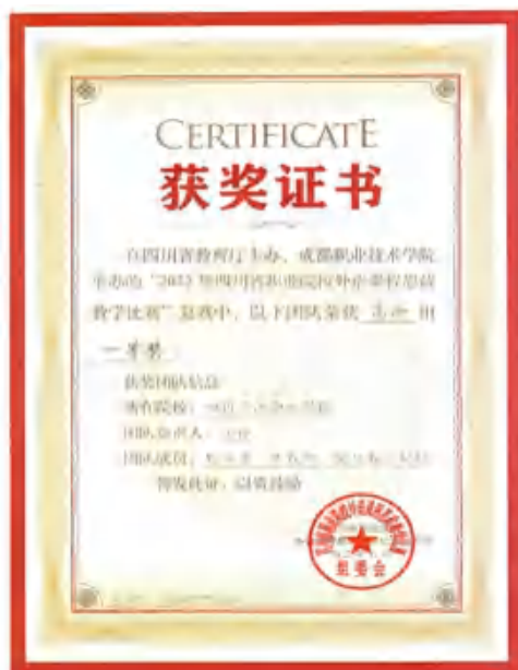
图 4 学校英语教学团队荣获外语课程思政教学比赛一等奖