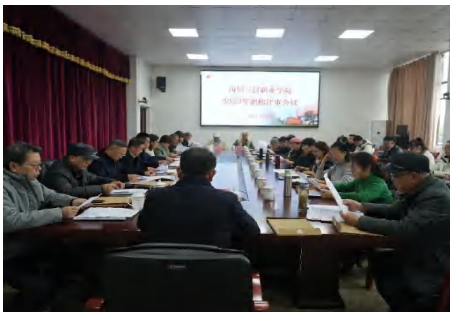
图 2 学校持续加强教师队伍建设，开展 2023 年度职称评审工作

师 98 人，其中高学历教师 71 人，高职称教师 6 人；评定副高级职称教师 6 人，中级职称教师 18 人，初级职称教师 60 人；组织教师参与岗前培训 106 人、国培 14 人、网络培训 982 人次、挂职锻炼 12 人、学历提升 1 人。