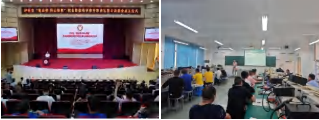
图 30 学校开展“黄丝带·同心帮教”职业技能培训