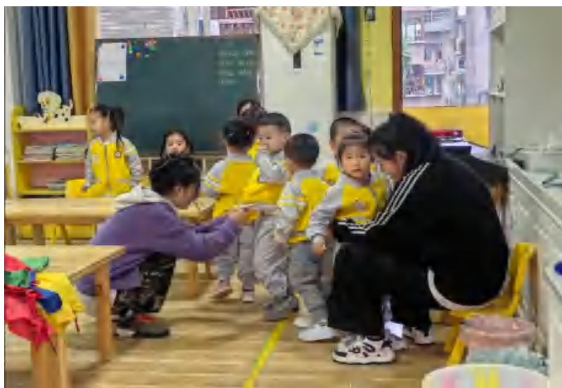
图 22 学前教育学院学生到幼儿园开展见习研习

——学校学前教育学院与合江县第一幼儿园、合江县第二幼儿园、合江县自强幼儿园、合江县快乐阶梯幼儿园、三河学院附属幼儿园等建立了深度的园校合作。2023 年，学前教育学院与合作园所建立“双导师制”，校外导师进入班级进行分享与指导 4 次，合作园所接收教师实践研修 25 人，园校合作共同开发教材《幼儿美术》，园校合作共同参加四川省教师教学能力大赛（二等奖），合作园所接收学校学生参加教育研习 430 人次，参加教育见习 1300 余人次。