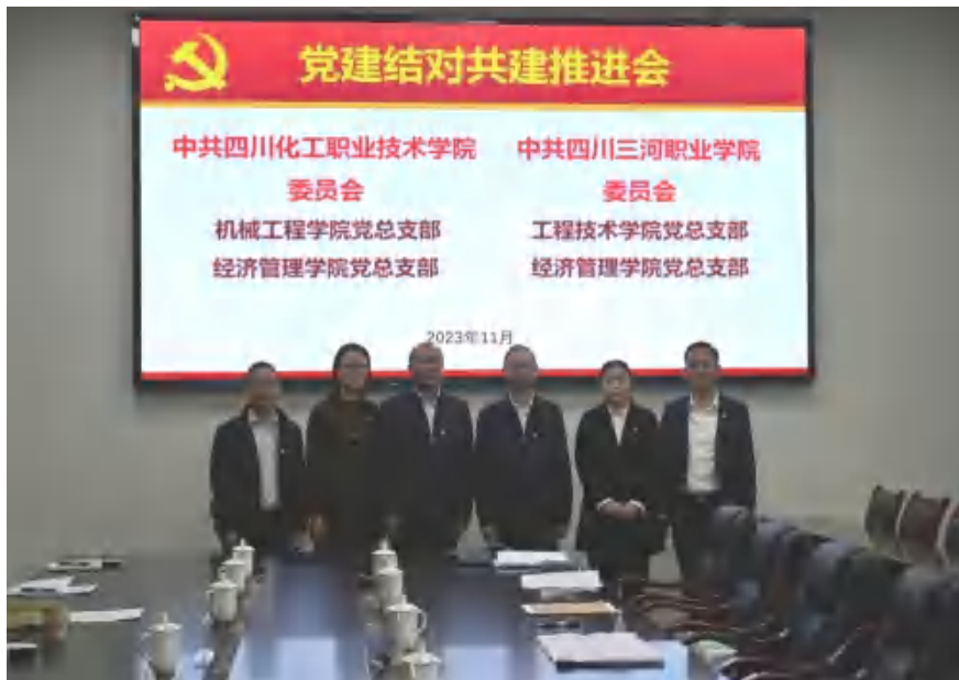
图7 学校党委与四川化院党委开展党建结对

《二级学院党政联席会议议事规则》等制度。落实干部“一岗双责”，定期召开思想形势分析会、网络意识形态专题会等，严格宣传信息发布审批，加强网络信息安全和舆情监管，抓好重大活动、重要会议和敏感时段安全稳定工作，思想教育持续加强。2023年9月，学校与四川化工职业技术学院党建结对共建，以党组织“1+2+2”模式深化合作，支部组织功能明显加强。