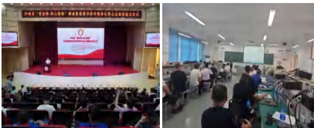
图 25 学校对社区矫正人员开展职业技能培训

学校受泸州市司法局委托，于2023年5月29日至6月2日期间，对50名社区矫正对象和强制隔离戒毒人开展了泸州市“黄丝带·同心帮教”职业技能培训，培训内容包括专业技能、心理健康、安全教育等方面，帮助他们为往后的就业打下了基础。