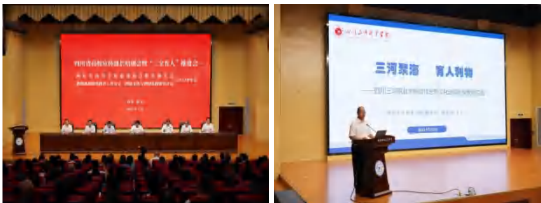
图 8 学校党委副书记王华在四川省高校宣传部长培训会暨“三全育人”推进会上发言