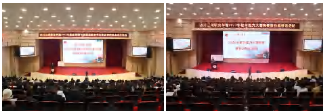
图 3 学校以赛促教，常态化举办课程思政教学比赛、教学能力大赛

2023 年，学校教师积极参加四川省职业院校教师教学能力大赛等省市级赛项，荣获奖项 13 项；教师积极投身科研教改，获批四川省教育厅、泸州科技局等省市级课题立项 35 项，发表论文 70 篇，获取专利授权 6 项，成果获各级各类奖项 10 项，详情见表 3-7：