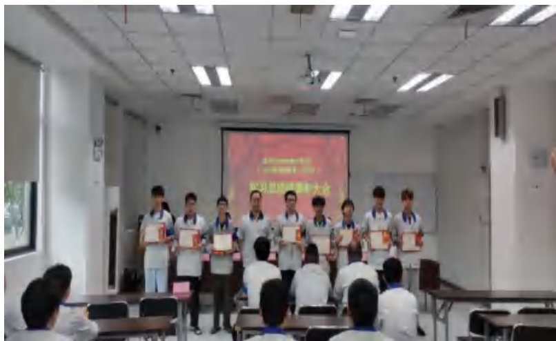
图 21 工程技术学院现代学徒制试点班级开展总结表彰会

——学校学前教育学院与合江县第一幼儿园、合江县第二幼儿园、合江县自强幼儿园、合江县快乐阶梯幼儿园、三河学院附属幼儿园等建立了深度的园校合作。2023 年，学前教育学院与合作园所建立“双导师制”，校外导师进入班级进行分享与指导 4 次，合作园所接收教师实践研修 25 人，园校合作共同开发教材《幼儿美术》，园校合作共同参加四川省教师教学能力大赛（二等奖），合作园所接收学校学生参加教育研习 430 人次，参加教育见习 1300 余人次。